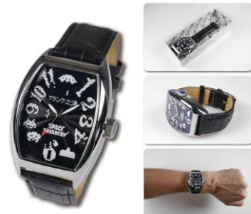
-フランク三浦 スペースインベーダーモデル-

© TAITO CORPORATION 1978, 2016. ALL RIGHTS RESERVED.