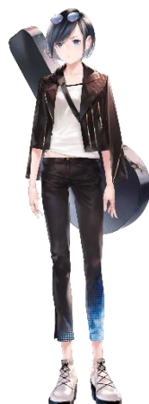
雪片カナデ CV. 大空直美