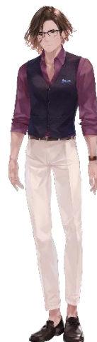
志島リョウ CV. 神谷浩史