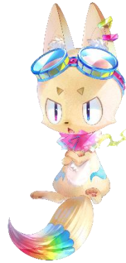
ビビット CV. 古川登志夫