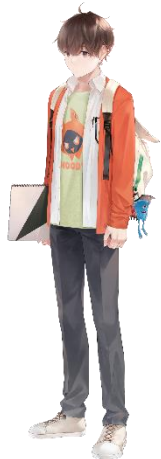
暁ヒロト CV. 島崎信長