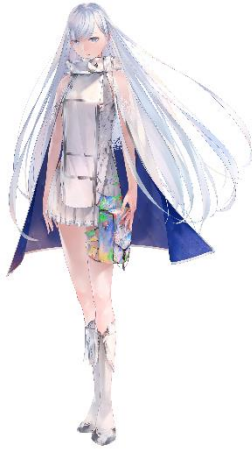
イーゼル CV. 沢城みゆき