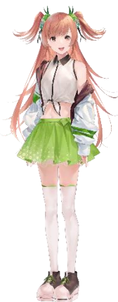
七海ナギ CV. 藤井ゆきよ