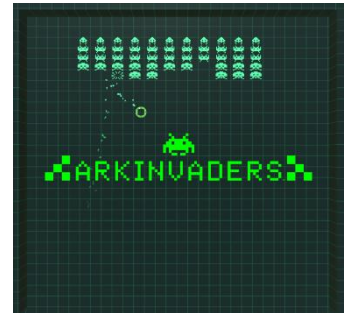
※画像は開発中のものです