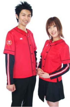
新ユニフォームのデザイン