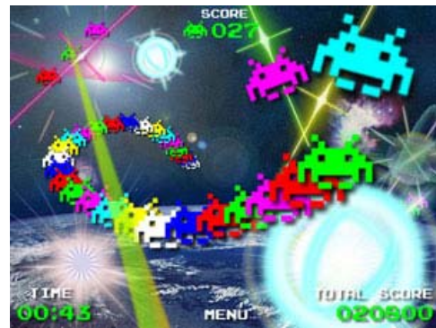
※ゲーム画面は開発中のものです。