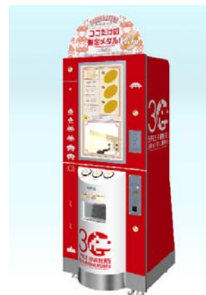
オリジナルメダリーフ