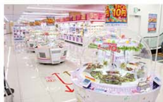
タイトーステーション ビックカメラ千葉店