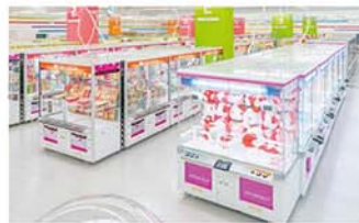
タイトーステーション 府中くるる店