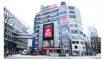
タイトーステーション 池袋西口店