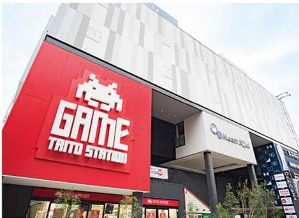
タイトーステーション 溝の口店