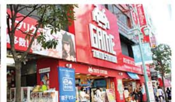
タイトーステーション 新宿南口ゲームワールド店