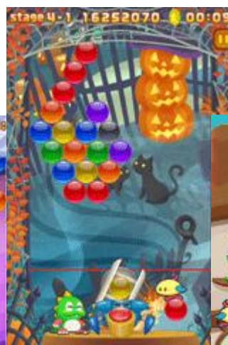
タップゲショット プレイ画面