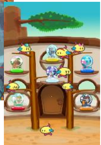
ストーリーモードに登場する マジックドームとちゃっくん